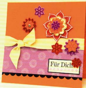
Karte „Für dich“