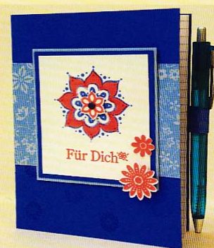
Notizbuch „Für dich“